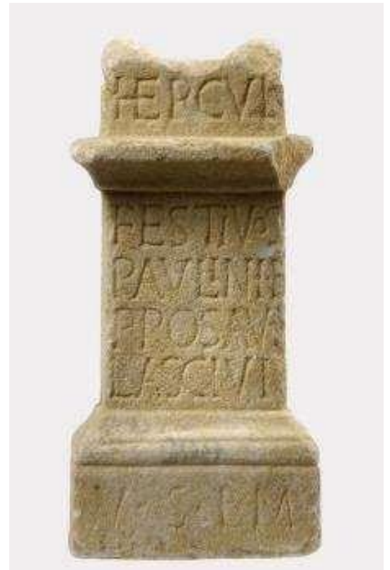
Autel votif dédié à Hercule, Comminges, IIIe siècle Hauteur en cm 33,7 ; Largeur base en cm 16 ; Largeur corps en cm 12 ; Profondeur base en cm 9,8 ; Profondeur corps en cm 5,9.