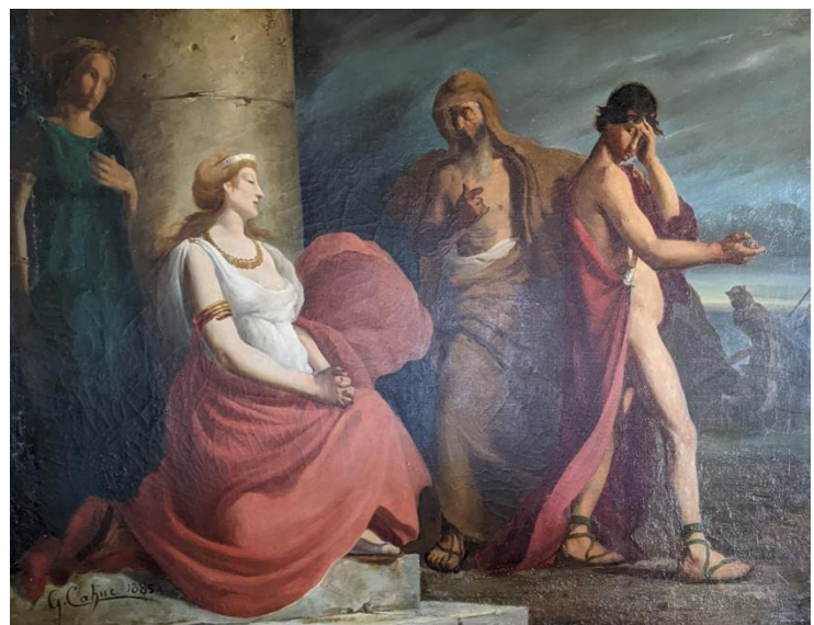
Le retour d'Ulysse, Gabriel Cahuc, 1883. Huile sur toile. Inscrite au titre des monuments historiques. Ville de Pamiers.