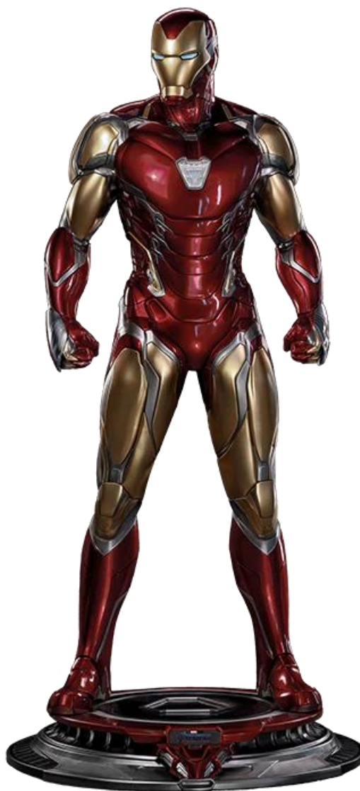
Iron Man > Figurine collector

Hauteur 204 cm - largeur 112 cm - Ech 1 :1 ©Queen studio.