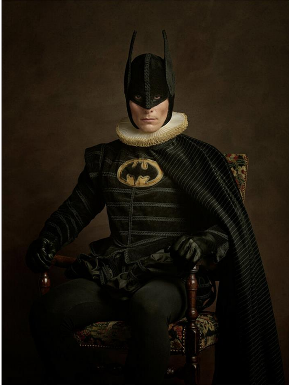
Batman, Sacha Goldberger, © Sacha Goldberger