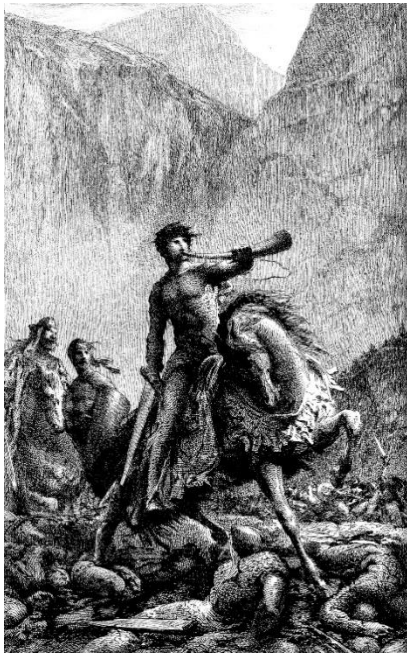
Léon Gautier, La Chanson de Roland , ©BNF.