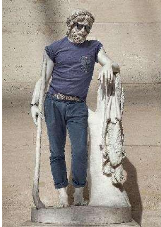
Portrait de Léo Caillard, extrait de la série Hipster in stone, 2012. Photographie. Fine art print. 120x180cm.(c) Léo Caillard