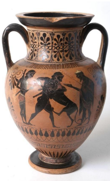
Amphore, 550 avt JC. Hauteur en cm 21,2 ; Diamètre en cm 14.