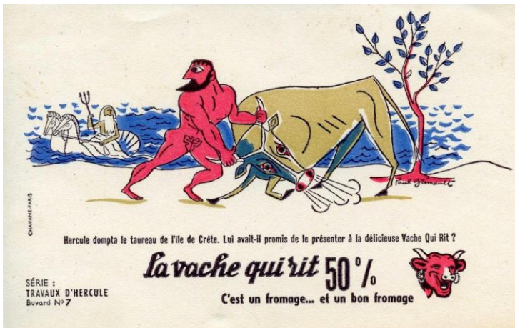
Paul Grimault (illustrateur), buvard publicitaire : "La vache qui rit. Hercule et le taureau de Crète", Collection : "Travaux d'Hercule n° 7", éditeur : Chavane, Paris, 1955. © Collection Salem Tlemsani. Format A5-