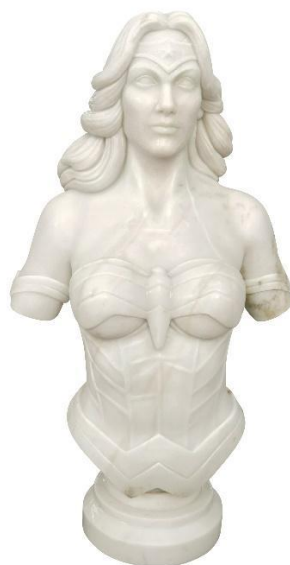
Léo Caillard, extrait de la série Hipster sculptures, 2016. Sculpture, marbre et bronze. 75x50x45cm. ©Léo Caillard