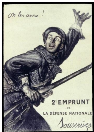
Affiche 2e Emprunt de la Défense nationale. Crédit Lyonnais. Devambez, imp. (Paris), 1916. 120 x 80 cm.